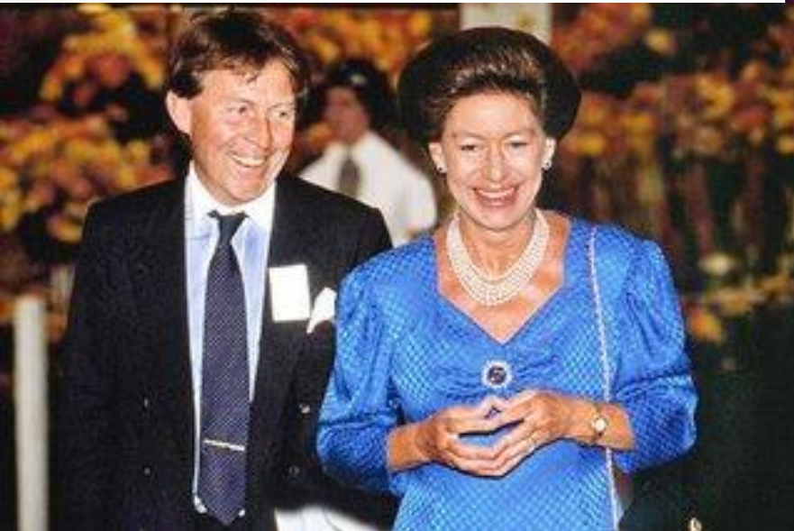
Roddy Llewellyn 1973