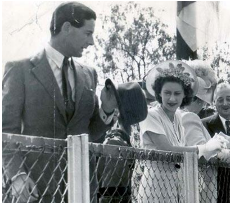
Princess Margaret Peter Townsend