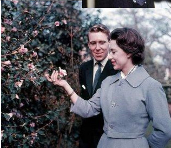
Antony Armstrong- Jones 1960